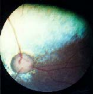
Afbeelding 2. Dit is het netvlies van een hond met PRA