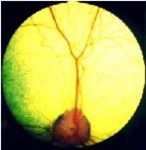
Afbeelding 1. Zo ziet het netvlies er normaal uit!

De term PRA wordt, vooral in de fokkerswereld, gebruikt voor een hele groep van aandoeningen aan het netvlies in het oog, waardoor er afwijkingen aan het gezichtsvermogen ontstaan. Om te kunnen begrijpen wat deze aandoeningen inhouden zal in dit artikel ingegaan worden op de bouw en functie van de retina, een andere naam voor het netvlies.